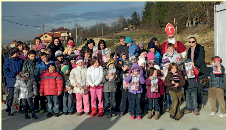
Zajedničko fotografiranje sa sv. Nikolom u Križancu i...