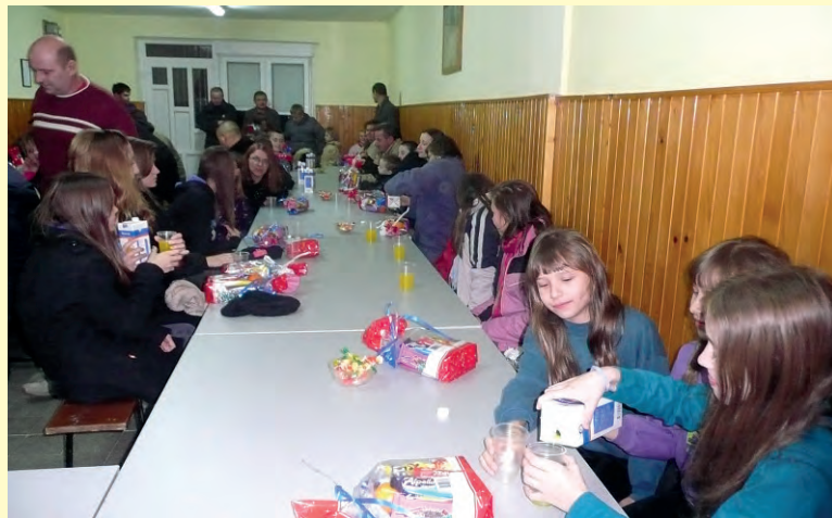
Prigodni pokloni za djecu iz Seketina

U nedjelju, 8. prosinca doček omiljenog sveca organizirao je i Malonogometni klub iz Križanca i Udruga žena sela Doljan. Prigodne poklone osobno je uručio sveti Nikola te tako razveselio ne samo djecu, nego i sve okupljene roditelje, bake i djedove. Pohvala svima za organizaciju i doček svetog Nikole.