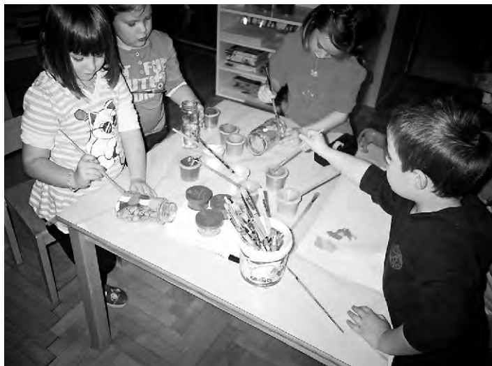
Dječji vrtić "Anđeo" uvelike doprinosi kvaliteti i kvantiteti obrazovanja naših najmlađih stanovnika

U ovom broju Općinskog lista nismo zaboravili na društvene aktivnosti, na Vrtić, udruge i društva koji svojim radom doprinose kvaliteti življenja u Općini Sveti Ilija. Evo neke od njih: