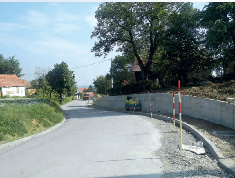
Sv. Ilija, sanacija prometnice i klizišta u Vinogradskoj ulici