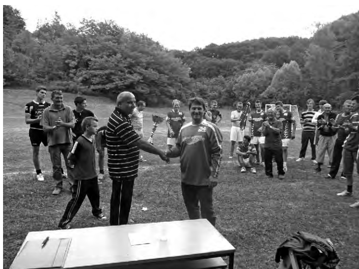
RŠU Seketin spada u red vrlo aktivnih i poduzetnih udruga. Važno je da se mladi redovito educiraju i okupljaju.