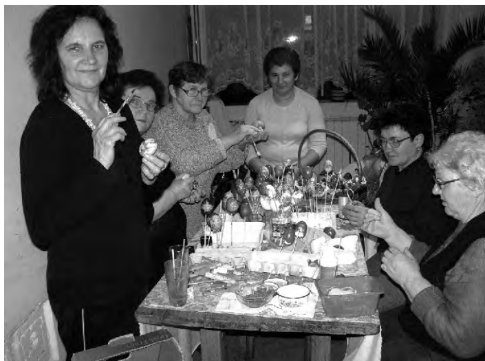
Vrijedne žene iz Doljana osnovale su Udrugu prije deset godina i dosad imale mnoge javne nastupe, priredbe i izložbe. Svaka čast !