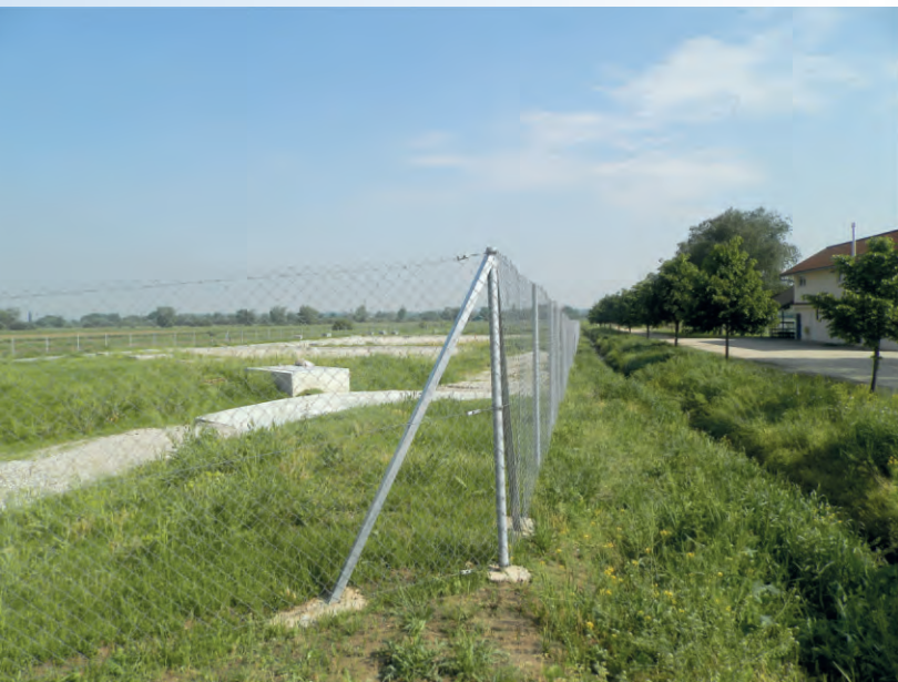
Biljni pročištač uskoro će biti pušten u pogon!