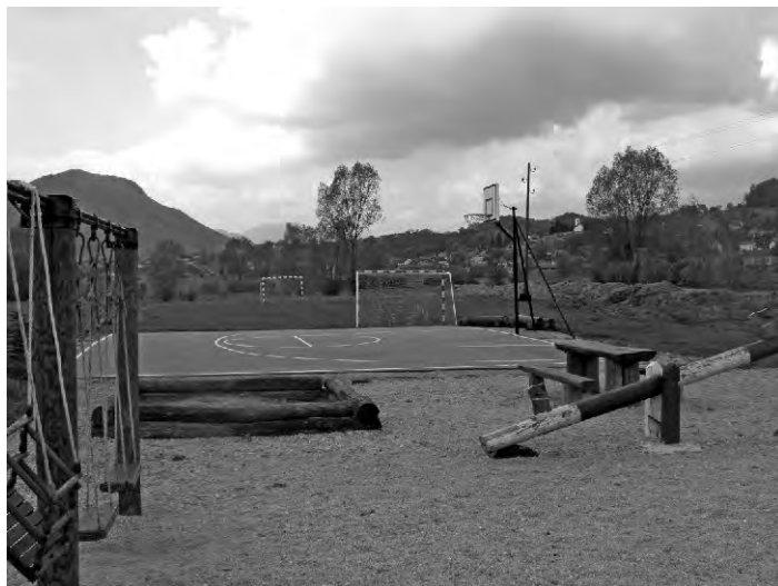
Igralište u Krušljevcu. Na uređenju igrališta, osim sredstava Općine, uloženo je i puno rada samih mještana i članova Mjesnog odbora

Uređenje staza od željezničke stanice do rijeke Bednje i put od Bednje prema obitelji Hrastić, Slugovine.