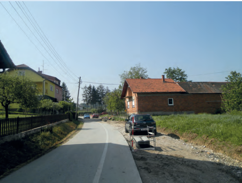
Proširenje Radničke ulice, rješavanje odvodnje i nogostup u Doljanu.

Lijepo vrijeme konačno je pogodovalo radovima pa je Općina Sveti Ilija postala jedno veliko prostrano gradilište. I dok drugi rade samo pred izbore, mi samo nastavljamo kontinuitet već ugovorenih radova.