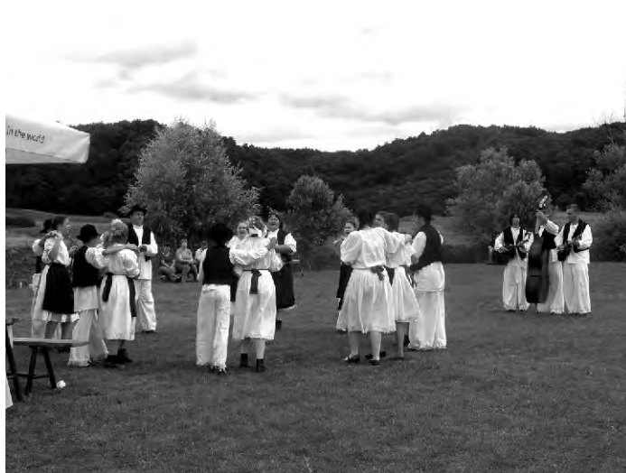
KUD Beletinec često promovira kulturu našeg zavičaja, a time i Općinu Sveti Ilija.