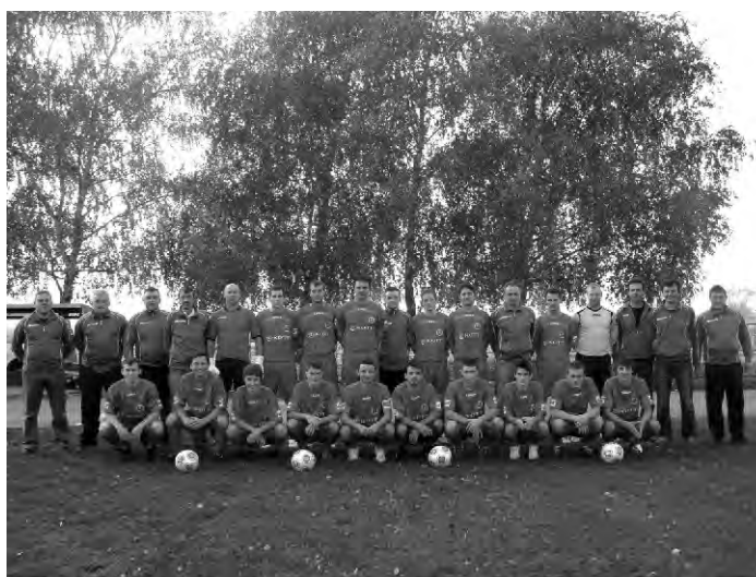
Jedna od „povijesnih“ fotografija igrača i Uprave NK Obreš prema kojima mnogi renomirani klubovi imaju respekta.