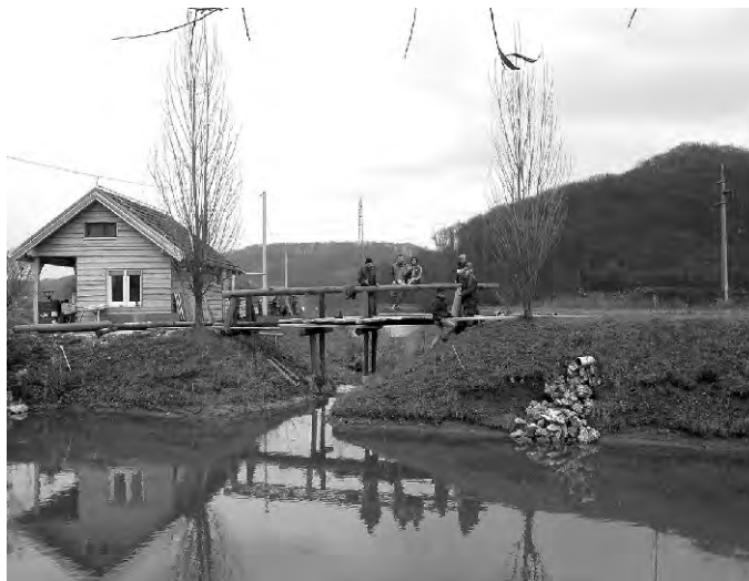
Članovi ŠRD Keder iz Beletinca redovito brinu o kvaliteti voda te kroz sportske aktivnosti promoviraju bogatstvo našeg zavičaja.