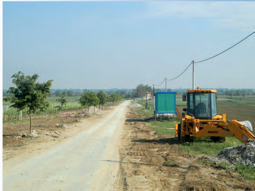
Sveti Ilija (Putine) spajanje kanalizacije zacjevljenje i izgradnja kišnog preljeva, od ulice Bana Jelačića s biljnim pročištačem