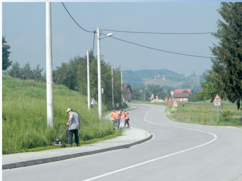
I "Javni radovi" u punom zamahu.