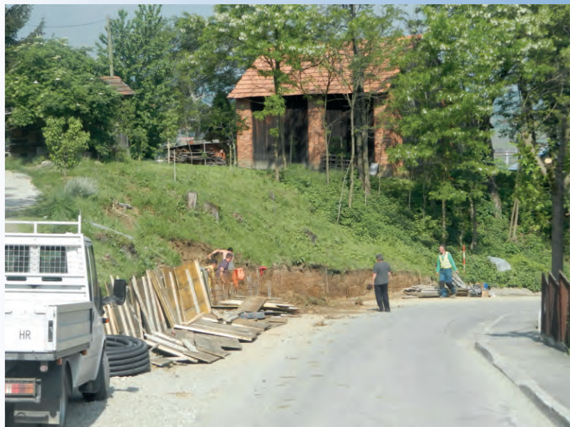
Centar Općine Sv. Ilija, Vinogradska ulica i sanacija klizišta