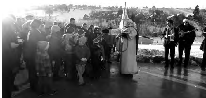
Sv. Nikola ove je godine obišao mnoga mjesta naše općine. U Križancu su ga, zahvaljujući složnosti mještana, dočekala djeca i tamburaši..

Sveti Nikola je tijekom nedjelje 9.12.2012.g. obilazio mnoga mjesta diljem Varaždinske županije pa je toga dana u poslijepodnevnom satima stigao i do Križanca.