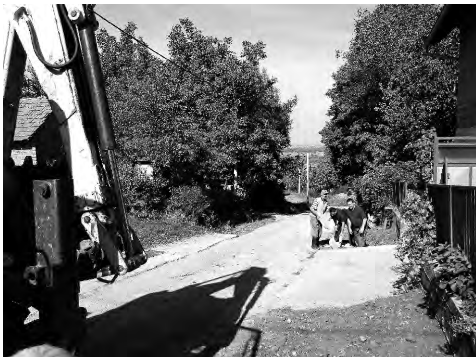
Žigrovec, Ulica A. Mihanovića - postavljanje betonskih odvodnih cijevi.

U tijeku 2012.g u Žigrovcu su izvedeni radovi na zacjvljenju kanala za odvodnju oborinskih voda u ulici Antuna Mihanovića čime je nastavljen trend uređenja sustava odvodnje oborinskih voda, a samim time i poboljšani uvjeti života za sve stanovnike te ulice (uklanjanje neugodnih mirisa, ljepši izgled ulice, sigurniji promet..). Nadalje koristimo priliku da najavimo asfaltiranje naše glavne ulice V. Nazora. Nakon dugotrajnog zalaganja čelnika Općine Sv. Ilija i članova MO Žigrovec imamo potvrdu iz ŽUC-a da će se početkom iduće godine (čim to dozvole vremenski uvjeti) izvršiti presvlačenje novim asfaltnim slojem (o.p.p. popularnim tepihom) ulica V. Nazora. S velikim veseljem očekujemo početak i završetak radova što će zasigurno razveseliti i sve mještane Žigrovca, a nama, koji smo ulagali ogromne napore da dođe do realizacije tih radova, novu snagu za nove ciljeve i ostvarenja.