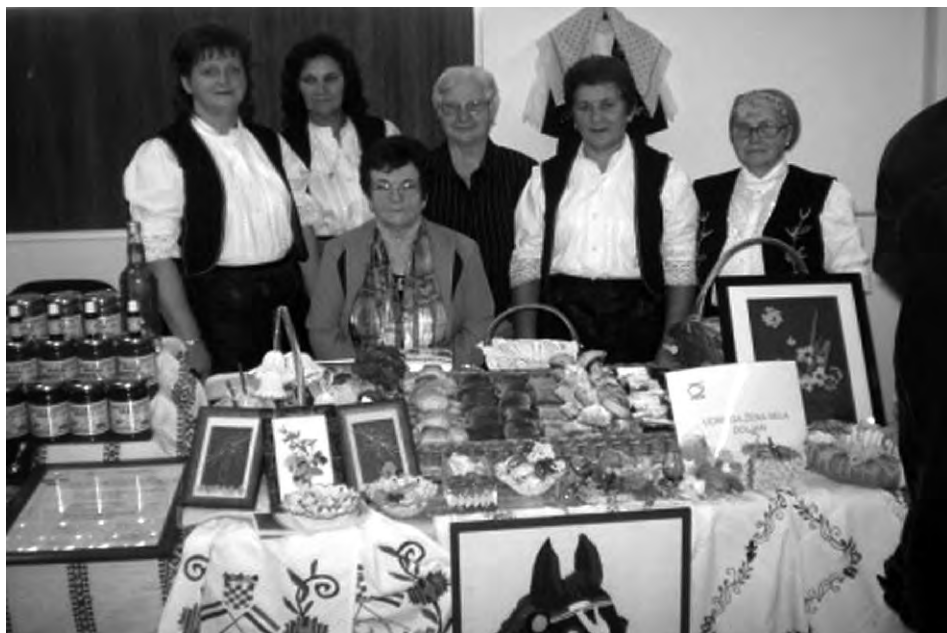
Naši mnogobrojni ručni radovi često ukrašavaju domove mnogih obitelji. Hvala svima koji nam pomažu.

Udruga žena Doljan tijekom 2012. godine odradila je sve planirane aktivnosti.