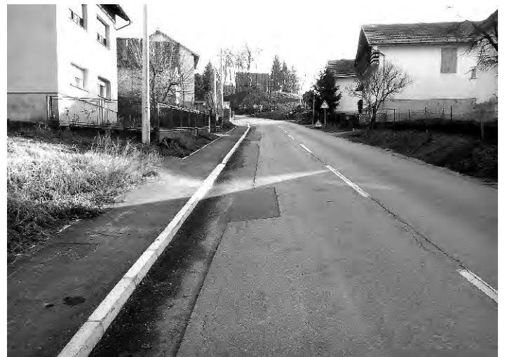
Vinogradska ulica u Sv. Iliji uskoro će biti potpuno uređena i sigurna za pješake