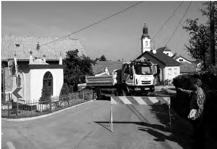
Uži centar naselja Sveti Ilija poprimio je potkraj studenoga ove godine sasvim drukčiji izgled. Naravno, u pozitivnom smislu!

Na inicijativu Općine Sveti Ilija u drugoj polovici ove godine prišlo se izradi Izvedbenog projekta za poboljšanje sigurnosti prometa u Vinogradskoj ulici, u samom naselju Sveti Ilija. Izgrađena je pješačka staza s rješenjem odvodnje zatvorenim sistemom u duljini od 500 metara, lijevom stranom od raskršća ulice Bana Jelačića prema Beletincu i do raskršća sa Školskom ulicom te nastavak Vinogradskom do ulice A.Korpara. Općina Sveti Ilija platila je izradu projekta (25 tisuća kuna). Natječaj za izvođača radova raspisala je Županijska uprava za ceste Varaždin i odabrana je ponuda „Ceste“ d.d. Varaždin kao