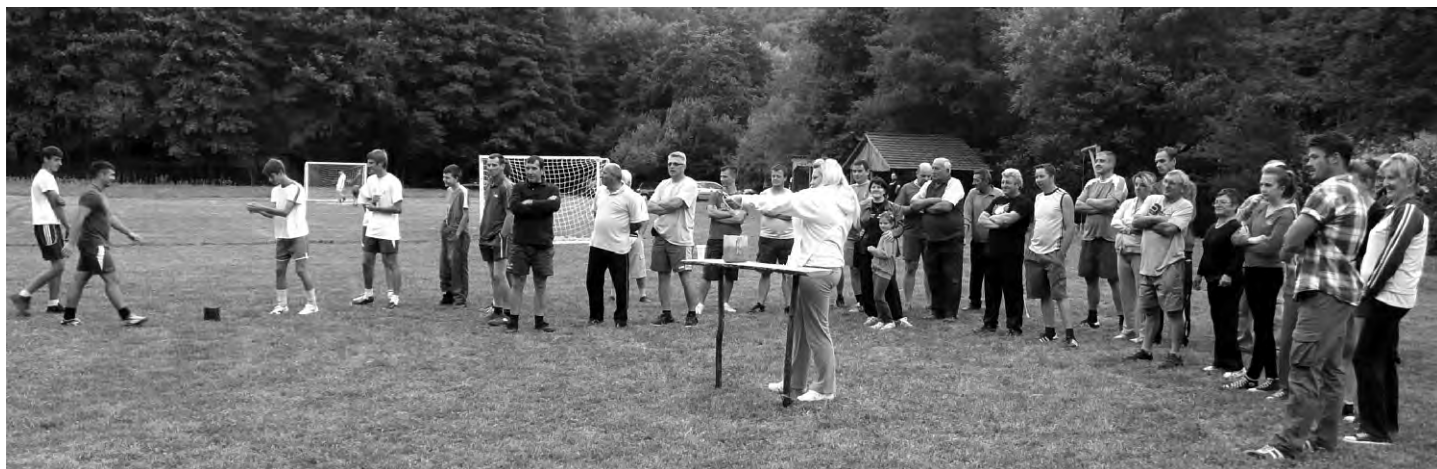
Od travnja do rujna sadržaja u Slugovinama nikad ne nedostaje.

U lipnju ove godine članovi Udruge započeli su s natjecanjem u Općinskoj malonogometnoj ligi koju je organizirala ekipa iz Svetog Ilije na igralištu u Doljanu.