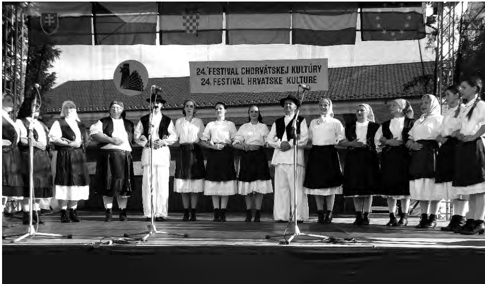
Nastup KUD-a "Beletinec" u D Novoj Vesi u Republici Slovačkoj

U proteklih jedanaest mjeseci ove godine KUD "BELETINEC" je doživio svoj novi procvat. Zahvaljujući općinskim i mjesnim čelnicima na vlasti koji su povećali sredstva iz proračuna, KUD je bio u mogućnosti pojačati svoje aktivnosti sa mnogobrojnim nastupima diljem Republike Hrvatske osnivanjem i radom "kreativne radionice", ponovnim radom dramske sekcije te radom i nastupima dječjeg folklora. Ove godine KUD je bio na smotrama u Drežniku na manifestaciji "Kolo na medanu", u Hrženici na proslavi 25. godišnjice osnivanja KUD-a "Juraj Lončarić", u Remetincu na "Čiselskom prošćeju", Ludbregu na županijskoj smotri folklora te je kao