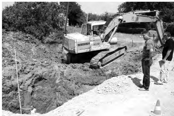
Sanacija klizišta na glavnoj prometnici Sv. Ilija-Beletinec zadala je mnogo problema vozačima, mještanima i Općini