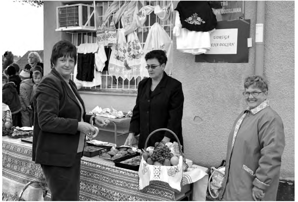
Listopad 2011.: Žene iz Doljana prilikom sudjelovanja na Danima kruha na Trgu J. Godrijana, u organizaciji OŠ „Vladimir Nazor“.

Nabavile su i potrebnu tkaninu za narodne nošnje kako bi sljedeće godine Udrugu promovirale u narodnim nošnjama našeg kraja te to vrijedno blago sačuvala od zaborava. Narodne će se nošnje tako pridružiti lijepoj i velikoj zbirci ručnih radova i starina (plahti, stolnjaka i ostalih predmeta).