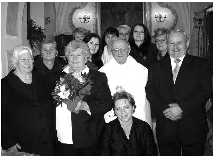
Obiteljsko zajedništvo čini ljubav jačom i postojanom

Prisjetili su se onog hladnog vremena kad su prije pola stoljeća, skromno odjeveni, vozili na kolima iz Beletinca prema Svetom Iliji. Tada, jednako kao i danas - grijala ih je ljubav. Župnik je naglasio da se ONA vremena ne mogu uspoređivati sa današnjim. Skromnost i jednostavnost u siromaštvu stvarali su duhovno bogatstvo i zadovoljstvo