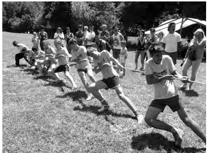
Povuci - potegni: svi za jednog, jedan za sve.

3. Krajem srpnja za završetak ljetne sezone u Slugovinama smo pripremili druženje naših članova i njihovih obitelji pod nazivom „Stari-mladi“. Susretu se odazvalo oko 50 članica i članova Udruge pa smo uz