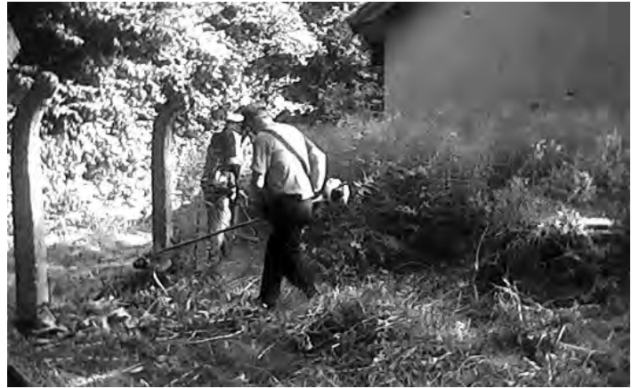
Čišćenje zaboravljene „strojarnice“. Ona je ipak naša!

U drugoj polovici kolovoza ove godine naš Mjesni odbor bio je i domaćin „Špancir pohoda“ kroz Slugovine u organizaciji Hrvatskog planinarskog