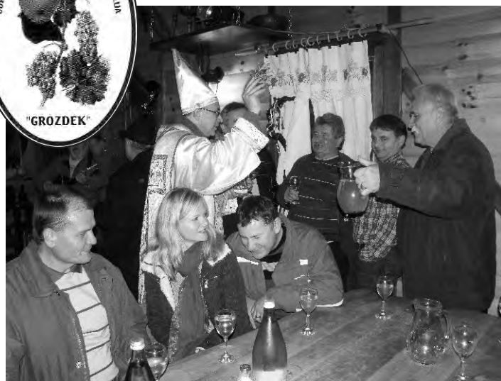
Sveti Martin prekrstio je mošt u vino i rado nazdravio s veselim gostima.

Možda je neprofesionalno pisati o vlastitim uspjesima Udruge, no, kao predsjednik najbrojnije udruge na području naše općine, dužnost mi je da barem u nekoliko crtica zabilježim naše osnovne aktivnosti.