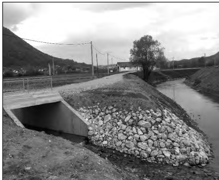
Novi most uz Bednju, nedaleko istoimenog nogometnog kluba

Po pitanju zaštite okoliša bit će uređen centar naselja (sadnja drveća i cvijeća) te uređenje autobusnih stajališta. Posebna pozornost usmjerit će se na javne površine oko dječjih igrališta i športskih terena.