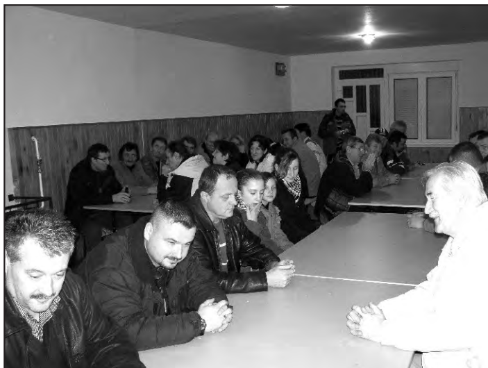
Svi nazočni pozorno su pratili tijekom skupštine

U akciju su se uključili svi mještani iz Seketina i na taj način spriječili možebitno odlaganje ovog opasnog otpada na neželjena mjesta. Pritom mislimo na šume i odvodne kanale u kojima se, nažalost, još uvijek može naći poneki opasna tvar. Akcija je naišla na dobar odjek, a zbrinjavanje otpada izvršilo je poduzeće „Duma-elektronika“ iz Varaždina.