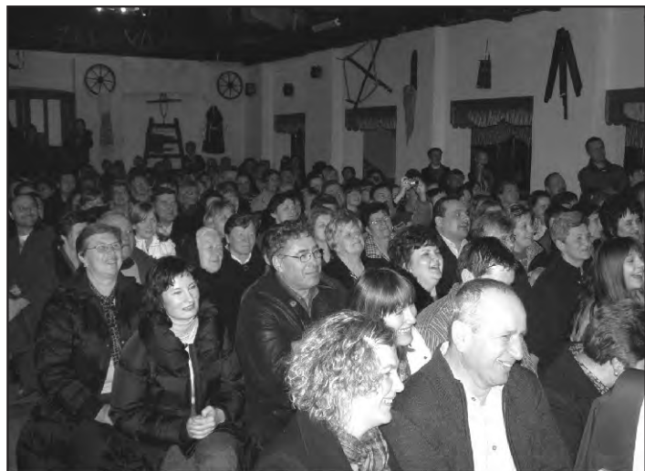
Najveće priznanje organizatorima bio je stalni osmijeh publike.