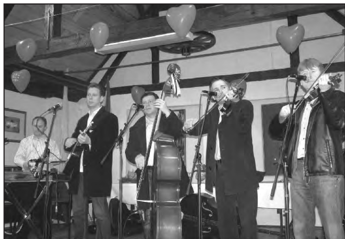
Kavaliri toliko dobro sviraju da se i na fotografiji čuje, zar ne?