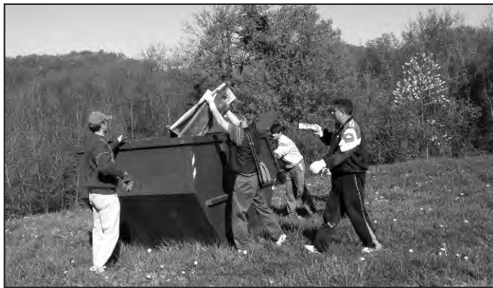
S riječi na djela. Važno je malo dobre volje i sve se može...

što su veliko bogatstvo, zbog šuma lakše dišemo i ukras su ovog našeg divnog krajolika.