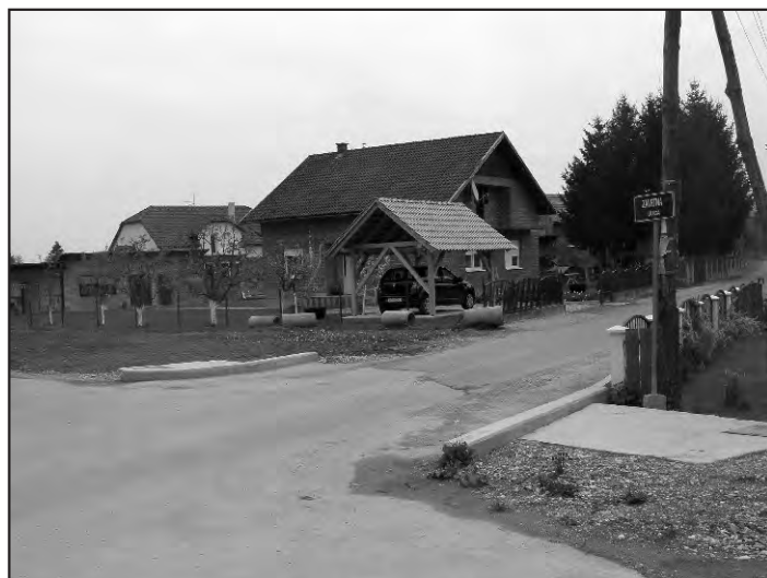
Raskrižje Ljudevita Gaja i Zavrtnice ulice u Doljanu

HEP: Radnička cijelom dužinom (nova rasvjeta) i ulica Lj. Gaja cijelom dužinom (nastavak).