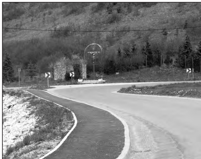
Nogostup na početku Beletinca