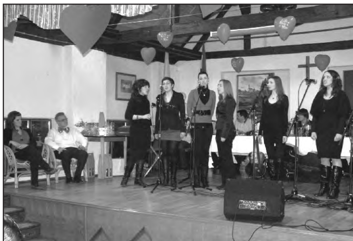
Za uho i oko – članice KUD-a „Ježek“ iz Beretinca

Iako su dečki z Bednje oduševili sve prisutne, ništa manje aplauza nisu dobili niti Cofleki koji su uz vrhunsku opremu i efekte pokazali kako se voli i svira tamburaška glazba.