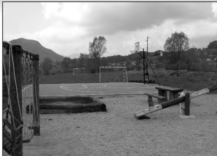
Dječje igralište u Krušljevcu

Vodovod: - rekonstrukcija Kalničke ulice (od križa prema Beletincu), dovod pitke vode na dvorište obitelji Bosilj.