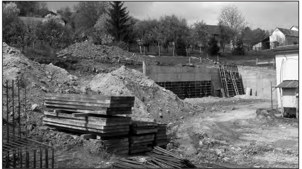
Početak izgradnje nove športske dvorane u Beletincu

Krajem 28. siječnja 2011. godine u Ministarstvu regionalnog razvoja šumarstva i vodnog gospodarstva u Zagrebu potpisan je ugovor između Ministarstva i Općine Sveti Ilija, kao naručitelja i „Meteor grupe“ d.o.o. iz Varaždina kao izvođača. Prema projektnom zadatku postojeću građevinu Osnovne škole u Beletincu potrebno je dograditi i u manjem dijelu rekonstruirati i dograditi novu školsku sportsku dvoranu (16x27m) s pomoćnim prostorima. Radovi su započeti i prema Ugovoru trajat će deset mjeseci. Ukupna cijena s PDV-om iznosi 5.068.154,53 kuna, od toga 70% sredstava osigurava Ministarstvo, a 30% Općina Sveti Ilija. Premda su mnogi žitelji Općine, a naročito žitelji naselja