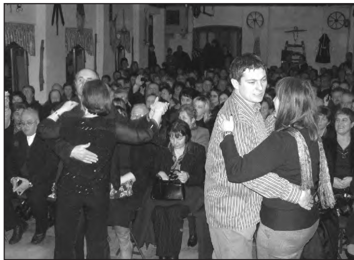
Na priredbi je bilo pjesme, veselja, igre i...plesa