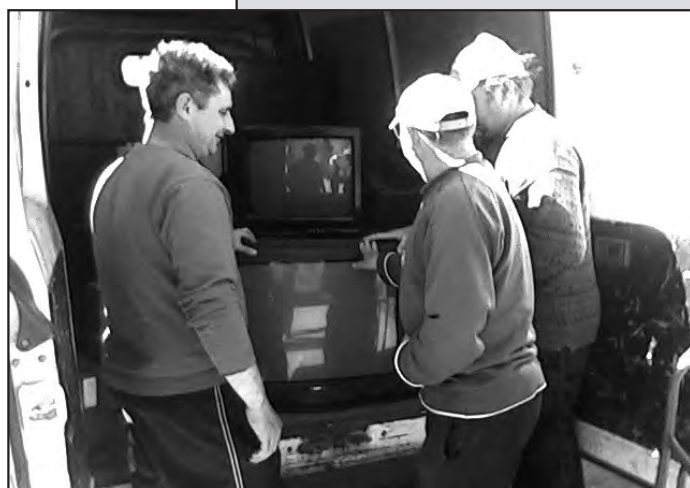
Članovi Udruge na djelu