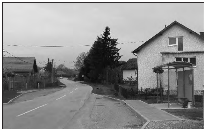
Autobusna stajališta u Tomaševcu B.

HEP: - rekonstrukcija ulice B. Jelačića (cijela dužina), ulice V. Nazora i Zagrebačka ulica (cijela na području općine).