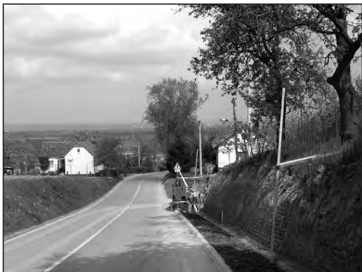
Početak gradnje nogostupa u Vinogradskoj, Sveti Ilija.

Jedinstveni upravni odjel općine sveti ilija