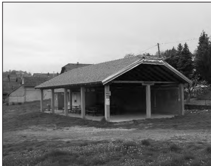
Uz postojeće igralište u Doljanu izgrađena je i nova nadstrešnica.