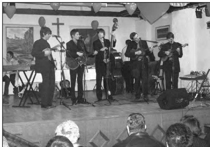
Cofleki su mladi, zgodni i zaljubljeni - u glazbu.