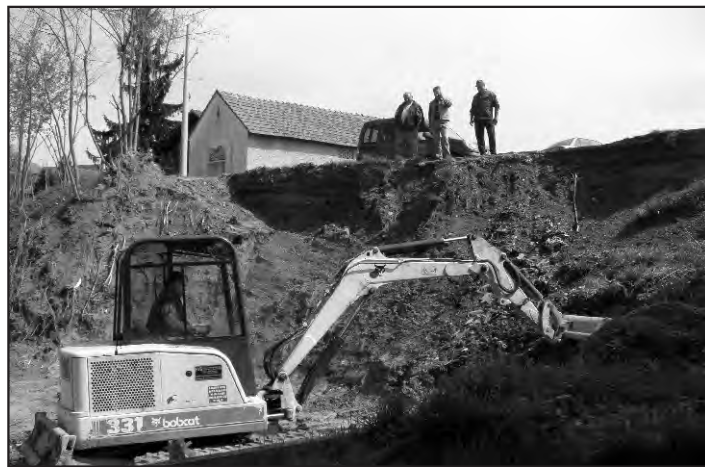
Sanacija klizišta zemlje u Zavrtnoj ulici u Seketinu