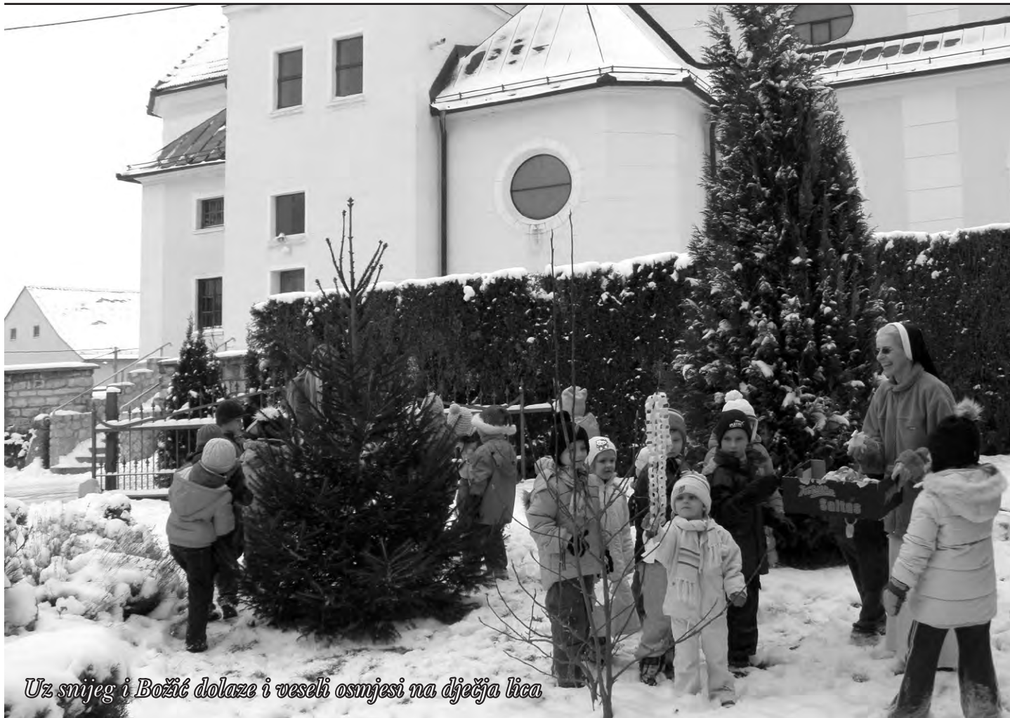
Uz snijeg i Božić dolaze i veseli osmjesi na dječja lica

Prosinac 2009. • broj 14 • besplatni primjerak