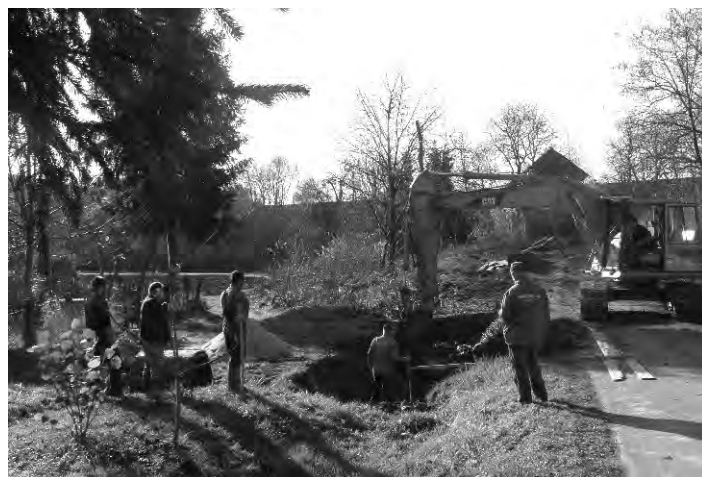
Na području cijele Općine za uređenje okoliša i ulica uložena su velika sredstva.

Rekonstrukcija i izgradnja vodovodne mreže realizirana je u Žigrovcu (cesta prema Conarima u dužini od 120 metara), Beletincu (Ulica S. Radića u dužini od 450 metara) te na Beretiščaku-Briški (u dužini od 800 metara). U 2010. godini planiraju se rekonstrukcije po svim naseljima, i to prema prioritetima mjesnih odbora.