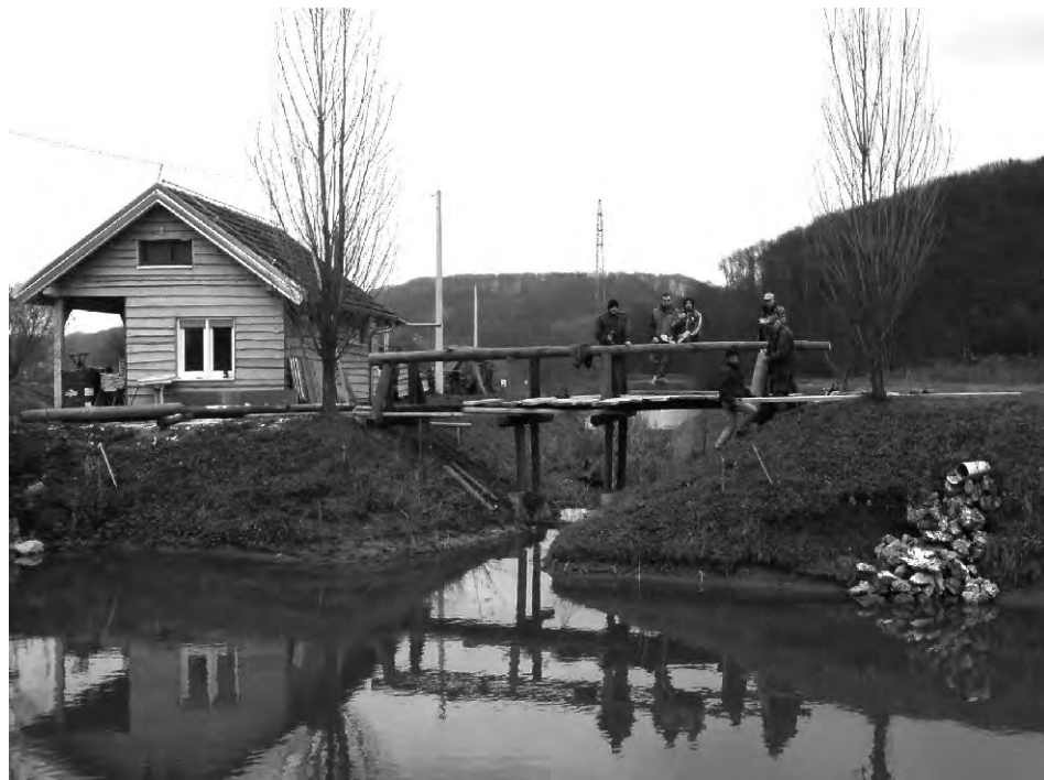
Ove godine uloženo je mnogo truda oko uređenja okoliša toka rijeke Bednje i ribnjaka.

Obavještavamo članove i one koji se žele učlaniti u klub da