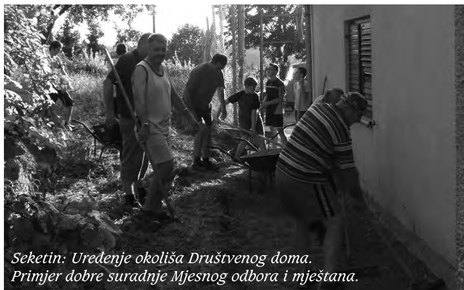
Seketin: Uređenje okoliša Društvenog doma. Primjer dobre suradnje Mjesnog odbora i mještana.

da pokrenu i SAMOSTALNO organiziraju niz akcija u svojim selima. To je pokazatelj da se uz malo volje može puno učiniti za svoje mjesto boravka. Hvala na suradnji!