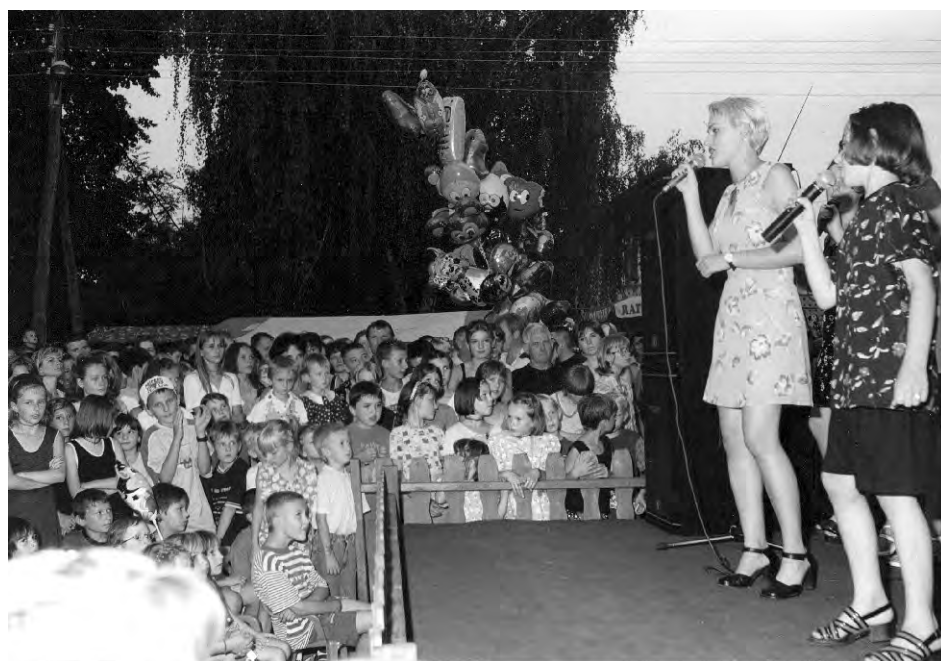
Tijekom proteklih petnaest godina na priredbama za "Ilijevo" sudjelovalo je više od dvjesto djece i mladih