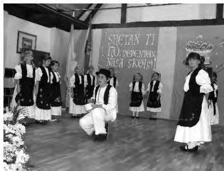
Detalj s proslave 170. obljetnice škole u Svetom Iliji održane u Pastoralnom centru Vilima Cecelje

U ovu školsku godinu škola je ušla sa 339 učenika u 16 razrednih odjela, 38 zaposlenika, od čega je 31 učitelj i stručni suradnik. Još uvijek radimo u dvije smjene, još uvijek