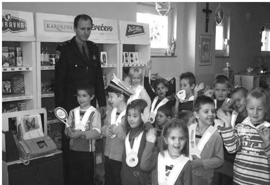
Policijski službenici PU Varaždinske prilikom obilaska općine i boravka u Dječjem vrtiću „Anđeo“.

Svjesni činjenice da je prometni odgoj i obrazovanje djece u poznavanju prometnih propisa, kao i podizanje prometne kulture izrazito važno već od najranije dobi, u Općini Sveti Ilija, u Dječjem vrtiću