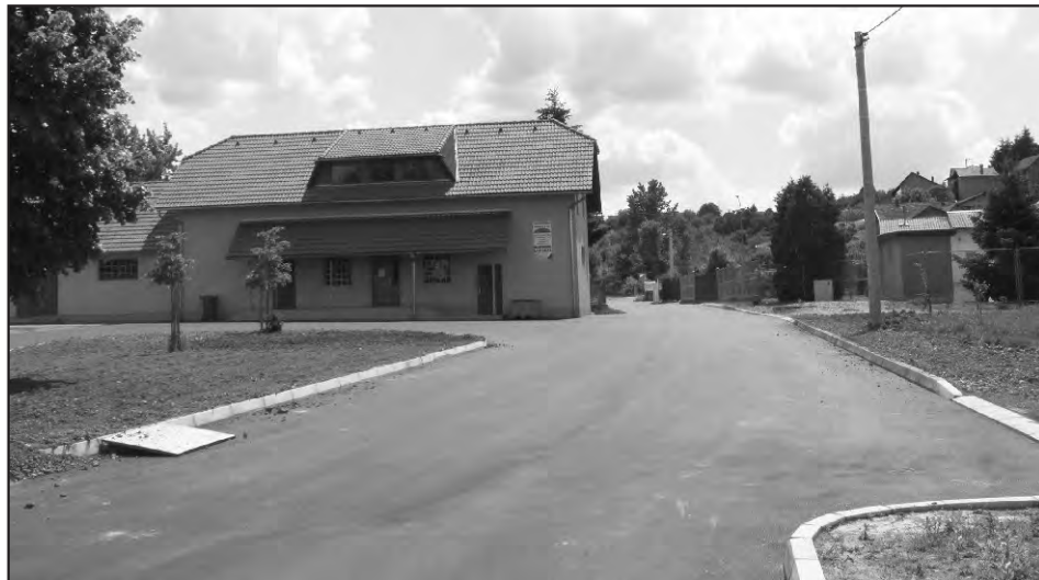
Na području cijele Općine za uređenje okoliša i ulica uložena su velika sredstva.

Izgradnja kanalizacije i nogostupa od Beretinca do groblja u Žigrovcu cca 2 milijuna kuna.