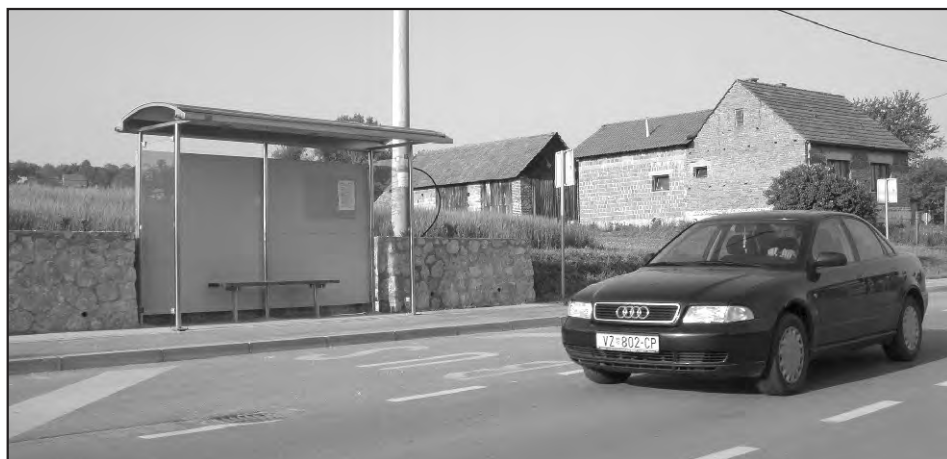
Zajedničko autobusno stajalište mještana Žigrovca i Doljana