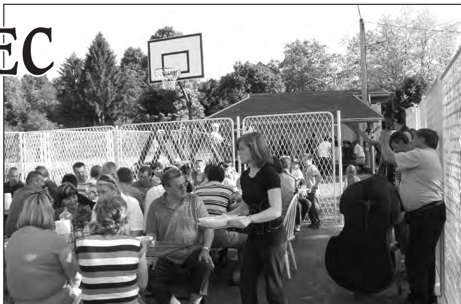
Detalj s proslave otvorenja igrališta, 9. svibnja 2009. g.

Kao što je navedeno u rečenica-ma podnaslova Žigrovec je smješten na padini, ali nam je izuzetno drago što smo zajedno s mještanima Žigrovca pronašli način kako osposobiti i urediti jedno malo, ali za Žigrovec itekako važno igralište. Ono je bilo nužno zbog velikog broja