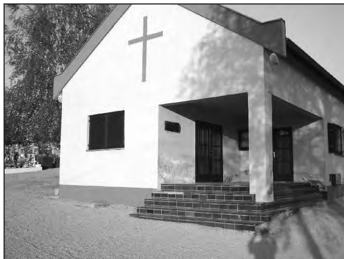
Grobna kuća prije uređenja

„Tko ne cijeni pokojne, taj ne će ni žive.“ Tim starim citatom željeli smo istaknuti važnost uređenja naših mjesnih groblja. S uređenjem, naravno, još nismo gotovi. Pročitajte što je dosad učinjeno i što još planiramo.