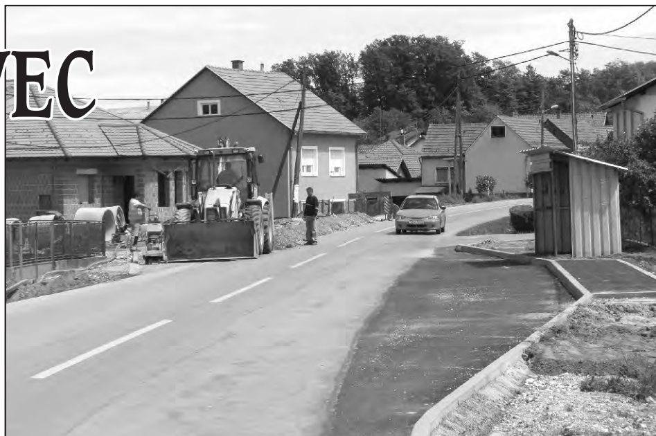
Radovi u Tomaševcu B. u punom su zamahu