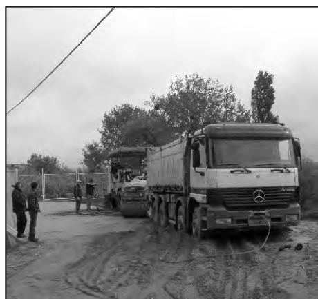
Asfaltiranje igrališta u Žigrovcu

Najviše zbog sigurnosti školske djece izgrađen je nogostup od groblja do Radničke ulice u Doljanu, na način da se najprije sanirao (zacijaevio) odvodni kanal uz cestu te, u skladu s propisima, proširila cesta i izgradila pješačka staza.