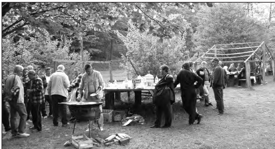
Detalj s nedavnog druženja mještana Seketina (3.5.2009.g., u sklopu prvomajske proslave).

Po cijelom naselju - uređenje javnih površina te oko društvenog doma.