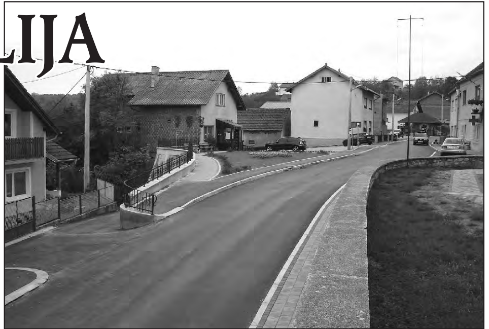
Novo uređeni trg u Svetom Iliji

Prilaz poduzetničkoj zoni - ulica V. Cecelje te nastavak na Kružnu ulicu s izlaskom na Vinogradsku (iz EIB II programa Ministarstva) osigurana su sredstva u vrijednosti od 300.000 kuna , a modernizacija Vinogradske ulice u dužini od 300 m iznosila je dodatnih 100.000 kuna . Zbog slabog napona i