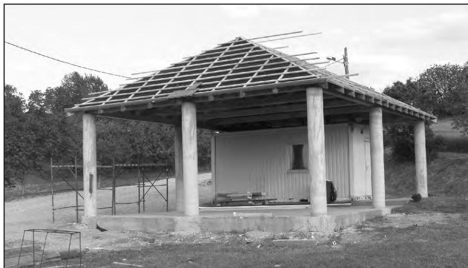
Nadstrešnica kod igrališta u Tomaševcu. Lijep i koristan objekt uskoro će biti u cijelosti uređen.

Sadnja drveća i cvijeća po čitavom naselju te održavanje okoliša oko igrališta.