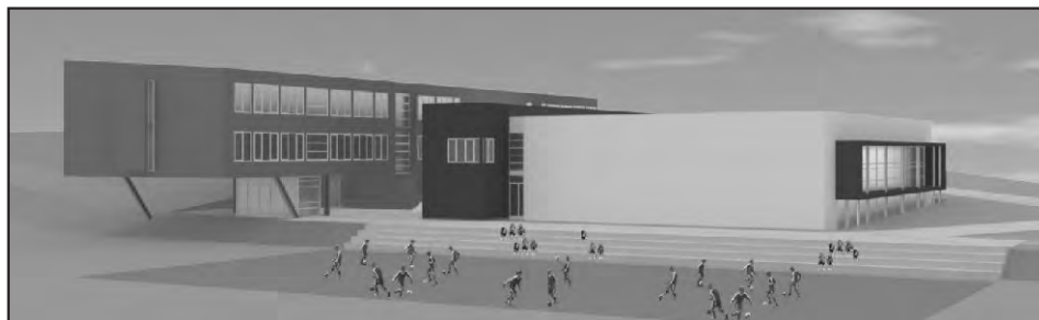
Bočni prilaz našeg budućeg ponosa (škola i dvorana u Sv. Iliji)

-Ukupna cijena izgradnje iznosi 5,5 milijuna kuna