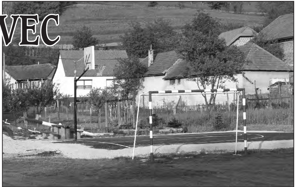
Igralište u Krušljavcu. Uz sredstva Općine, u uređenju igrališta uloženo je puno rada od strane samih mještana i mjesnog odbora.

Od svih naših naselja Krušljavec je najmanji u našoj općini. Prostora za širenje naselja ima, a s uređenjem prometnice Krušljavec Presečno (o čemu smo pisali u prošlom broju) to mjesto dobit će sasvim drukčiji značaj. Tu će se, prema nekim predviđanjima, tražiti gradilište više.