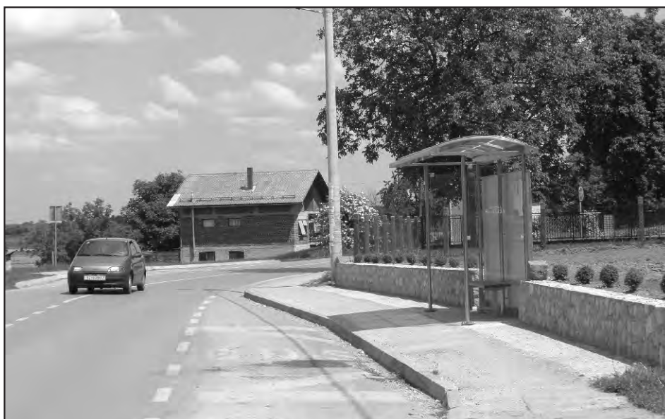
Sveti Ilija - Autobusno stajalište