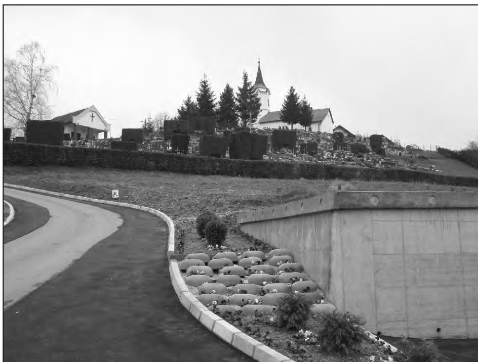
Mjesno groblje Beletinec

-izgradnja i uređenje staza (rubnici, asfalt, odvodnja)