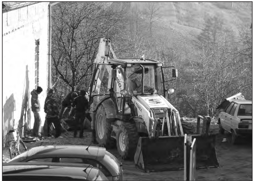
Kome smeta općinski stroj?

- Ukupno će se na području naše općine, a kroz razne investicije (školstvo, uređenje cesta, nogostupa te niz drugih projekata investirati 40 milijuna kuna