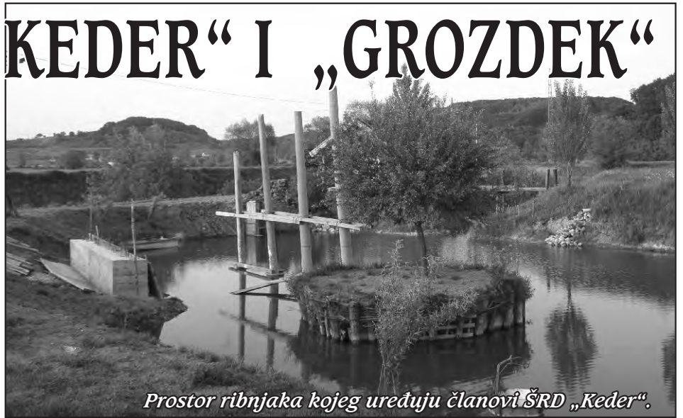
Prostor ribnjaka kojeg uređuju članovi ŠRD „Keder“.

Odabirom ovih dviju udruga nikako ne bismo htjeli umanjiti značaj i rad drugih društava koje u naslovu nisu navedene. Za ovaj put odabrali smo dvije, složite ćete se, najbrojnije udruge, ali i dvije koje su uložile značajna sredstva u svoj vlastiti razvoj. I Kederi i Grozdeki uvijek su na naš novčani poticaj znali otkriti donatore ili sponzore i nekoliko puta uvećati početni iznos.