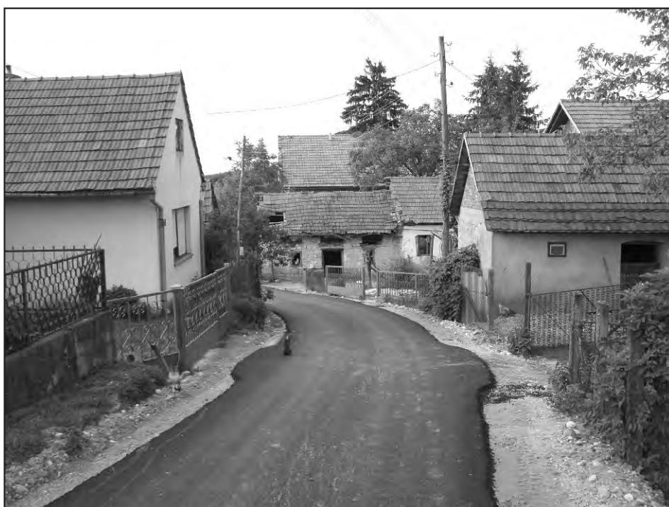
Dugo očekivani asfalt konačno je stigao i u zaselak Conari.

Uređenje staza od željezničke stanice do rijeke Bednje i put od Bednje prema obitelji Hrastić, Seketinu.