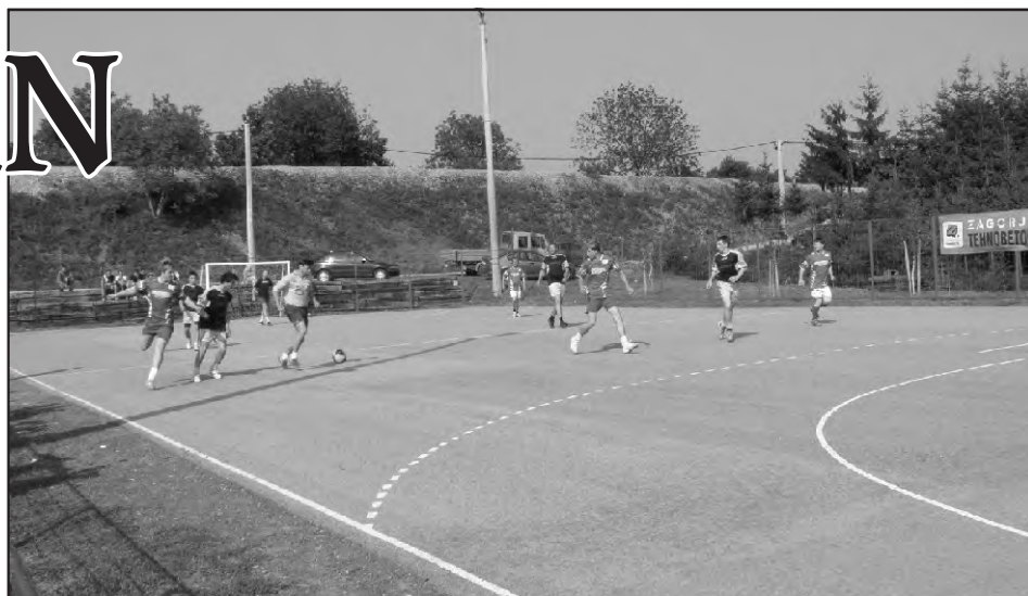
Ovogodišnji prvomjaski susret u Doljanu bio je u znaku sporta i druženja. Organizator: DŠR Doljan