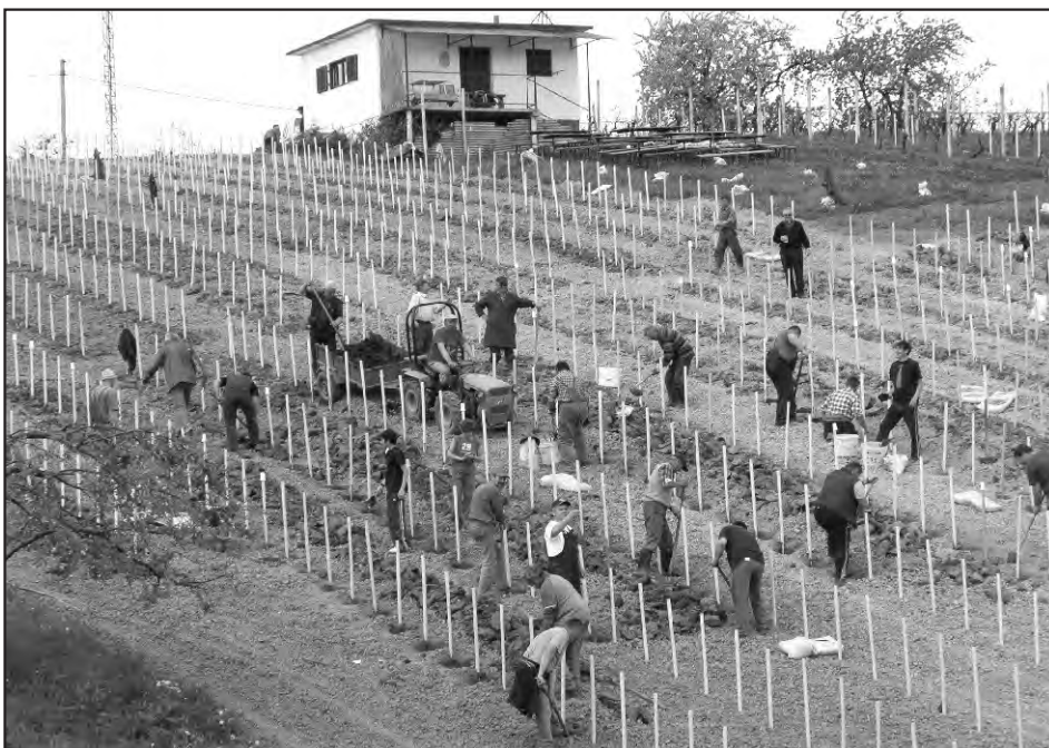
Travanj 2009. g.- Sadnja mladog vinograda na župnom imanju u Svetom Iliji. Uz brojne „akcijaše“ svoj doprinos dali su i članovi Udruge „Grozdek“.

Ovdje moramo napomenuti da je Općina kroz godinu dana investirala 10.000 kuna, ali zalaganjem predsjednika I. Kefelje te ostalih članova, udruga vinogradara je uspjela putem raznih donacija namaknuti još dodatnih 120.000 kuna koje su utrošili za kupnju prikolica, preša, muljača, bačvi, kontejnera, itd.). Bravo i za njih