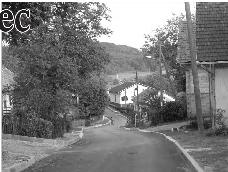
Novo ruho Vodovodne ulice

-Ulica S. Radića te svi odvojci uz navedenu ulicu (Betonski stupovi i nova svjetla) 350.000 kn