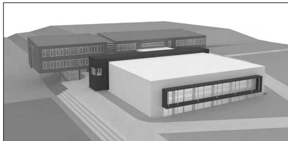
Ovako će izgledati nova ljepotica iz Sv. Ilije

Osobno sam svojim angažmanom uspio dogovoriti značajna novčana sredstva i to: