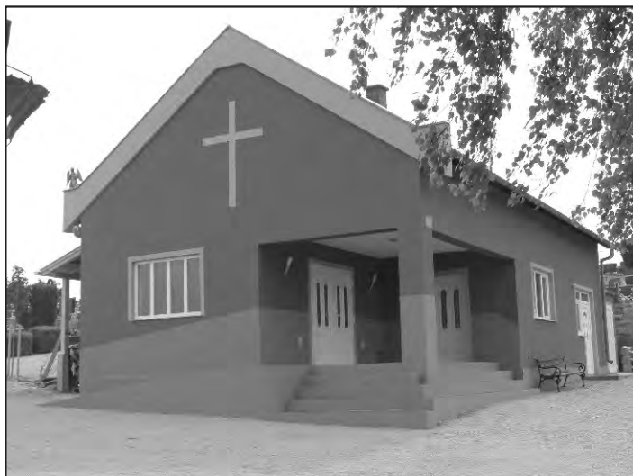
Grobna kuća u Žigrovcu nakon uređenja