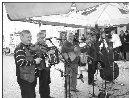
Legende tamburaške glazbe „Stari pajdaši“ (ili, svi su oni Vajda)