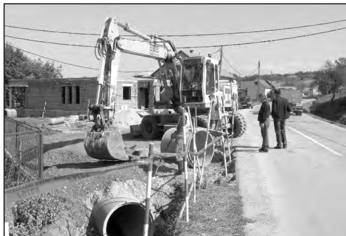
Autobusno stajalište u izgradnji.

Radove trenutno izvode djelatnici PZC-a. Za projekt će se utrošiti 380.000 kuna, a isti će biti dovršen prema vremenskim uvjetima i prema projektnoj dokumentaciji koja obuhvaća dolazak i odlazak autobusa s ovih stajališta. Izgradnjom autobusne stanice u ulici B. J. Jelačića (s južne strane) uredit će se i dio kanala koji je dosad prijeto poplavom obitelji Cepanec (plavljeno je dvorište i vrt.)