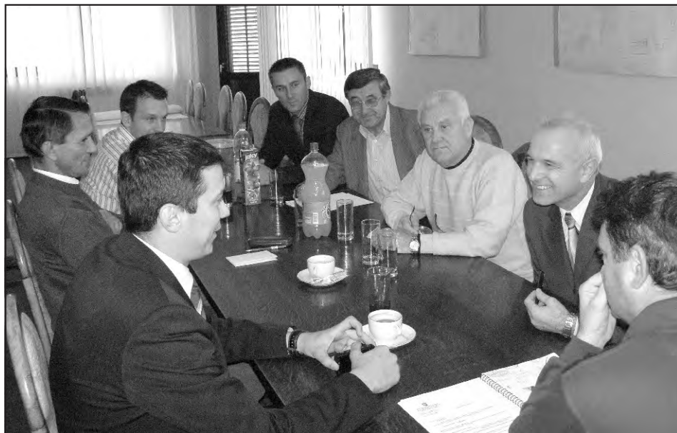
Zajednički susret čelnih ljudi Varaždinske županije s članovima Poglavarstva

ministarstva o financiranju izgradnje. Škola i dvorane će se graditi i to uskoro. Sufinanciranjem Županije i Općine krenut će se u realizaciju navedenih projekata.“