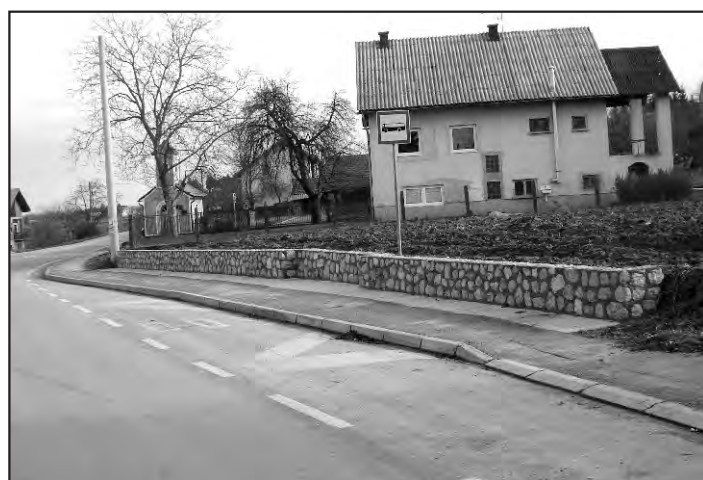
Novouređene autobusne postaje u Svetom Iliji i Žigrovcu (Doljanu) osim funkcionalnosti sada doprinose i ljepšem izgledu ovih naselja.