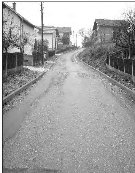
Vodovodna ulica će tijekom 2009. poprimiti još ljepši izgled.

Cijena projekta iznosila je 300.000,00 kuna, a u tom su iznosu s ukupno 65.000,00 kuna sudjelovali i